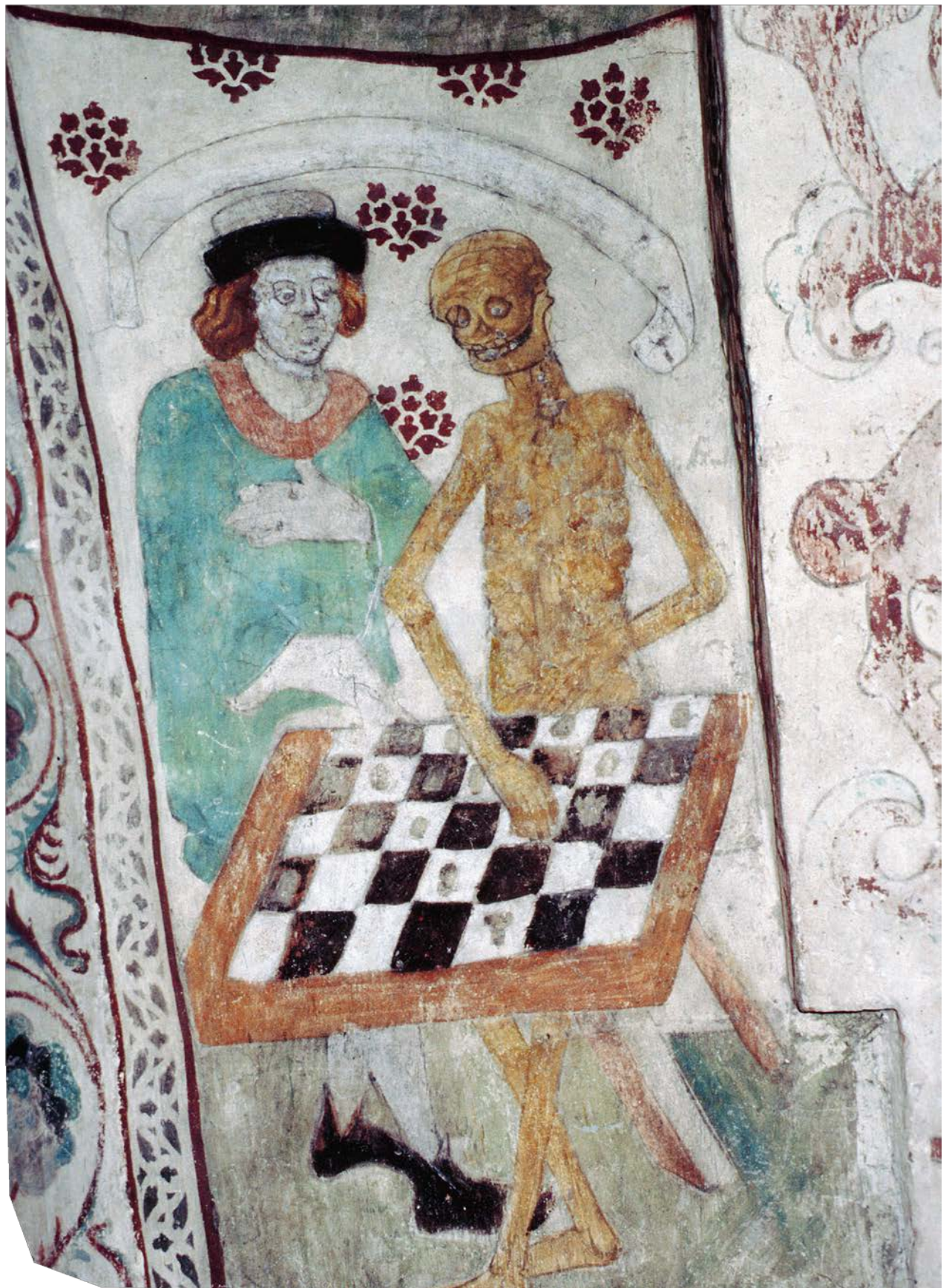
Jag spelar dig Matt av Albertus Pictor. Foto: Anna Ulfstrand, Stockholms läns museum.