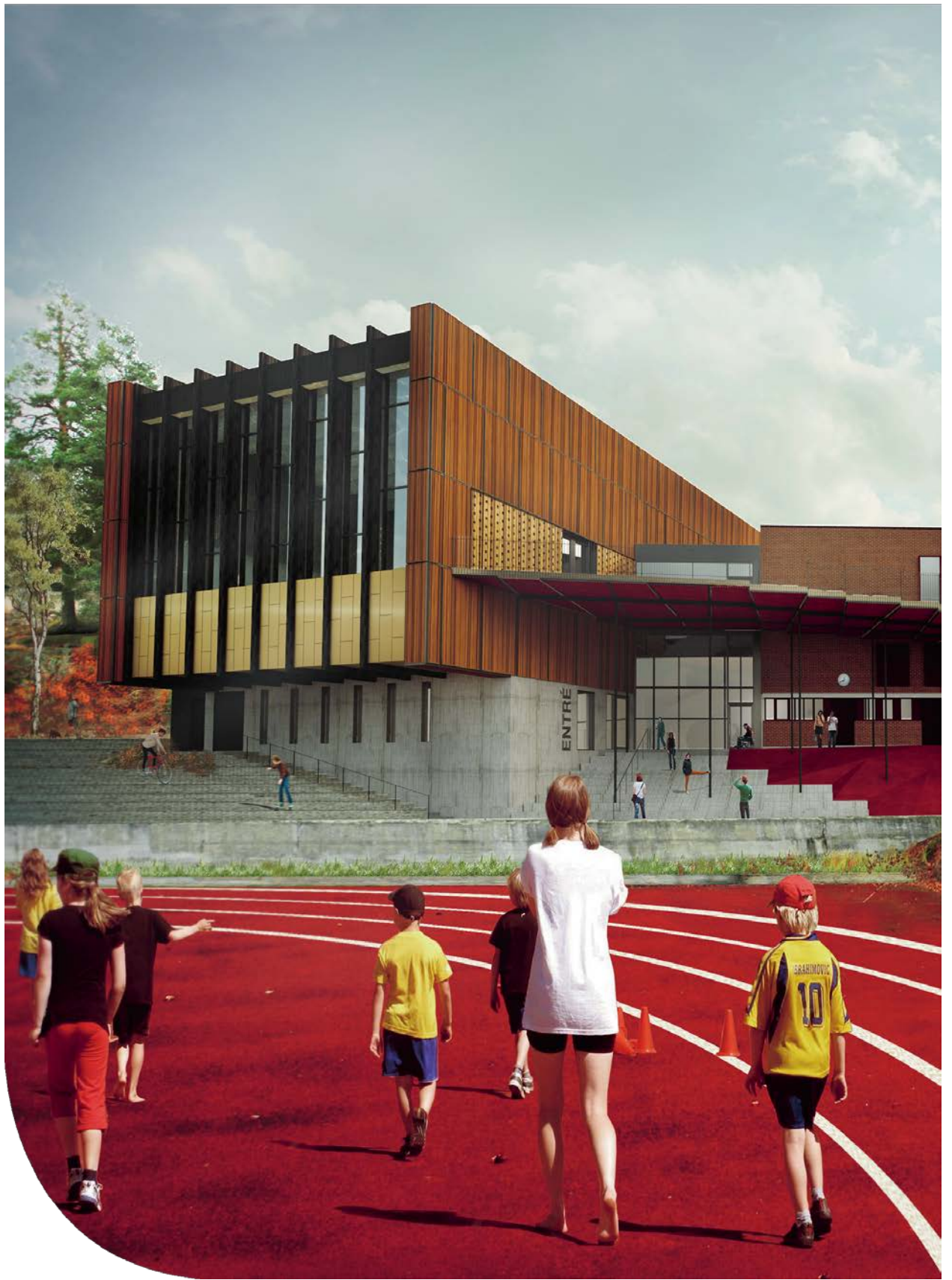
Sundbybergs simhall. Perspektiv av Urban Design.