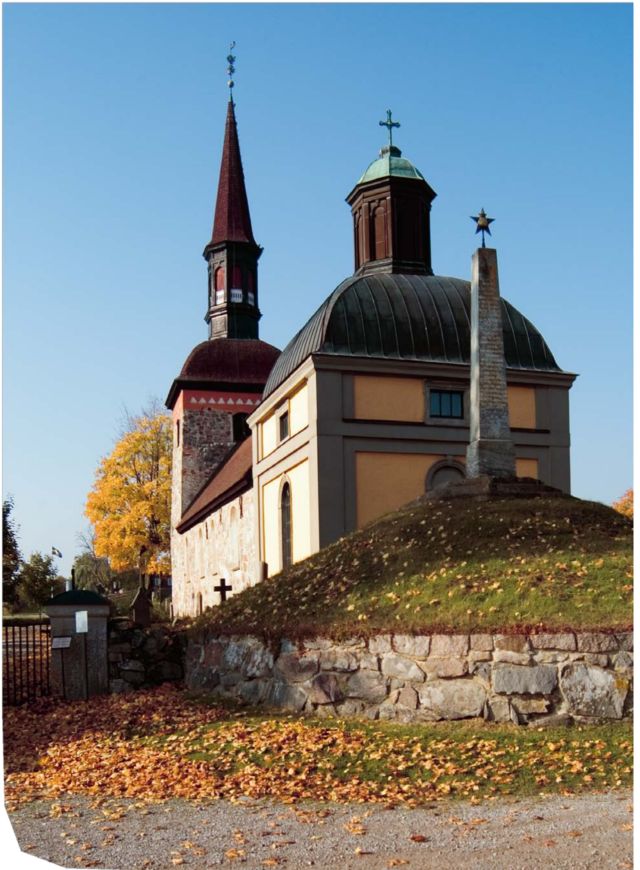
Lövö kyrka. Foto: Mattias Ek, Stockholms läns museum.