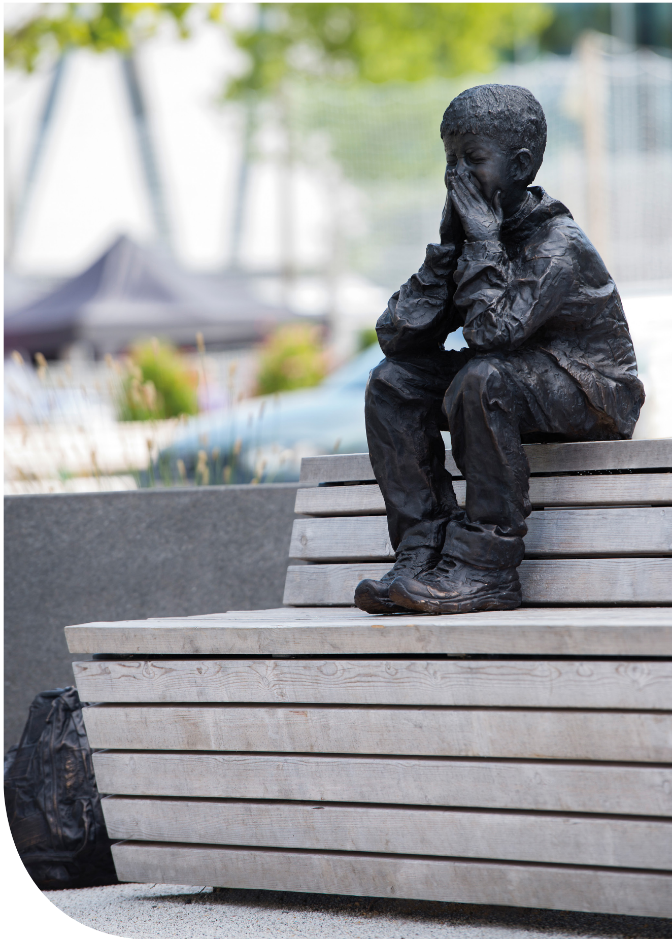
Gzim och den frusna sjön. © Knutte Wester/Bildupphovsrätt i Sverige 2018. Foto: Eva Dalin