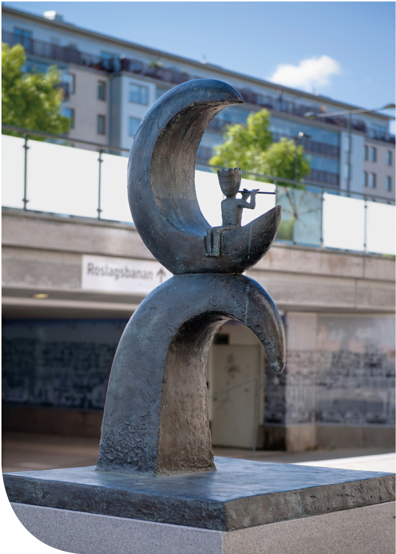
Lille Prins. © Mats Åberg/ Bildupphovsrätt i Sverige 2018. Foto: Eva Dalin