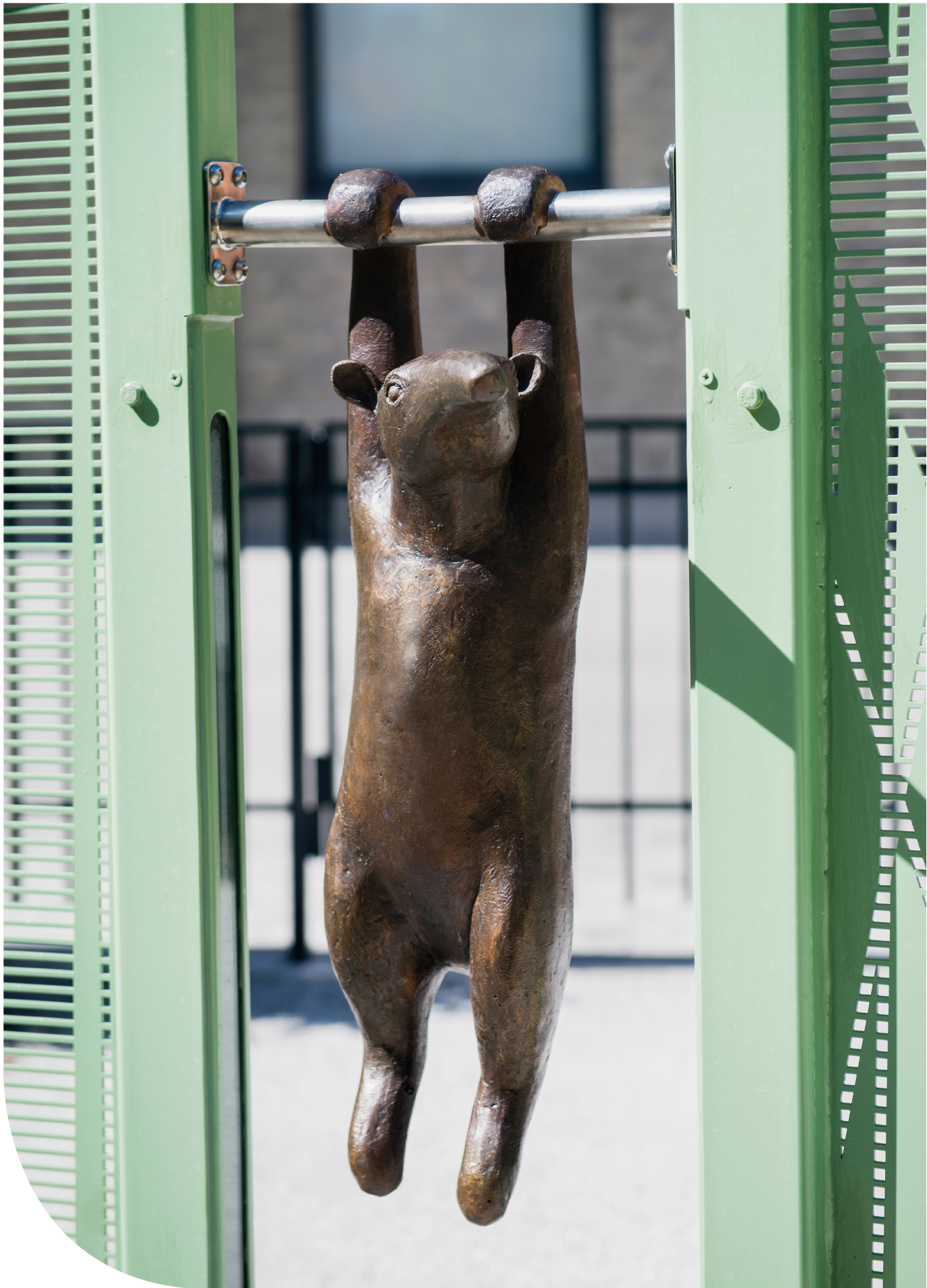
Djur i Vänortsparken. Tamadua. © Eva Fornå/ Bildupphovsrätt i Sverige 2018. Foto: Eva Dalin