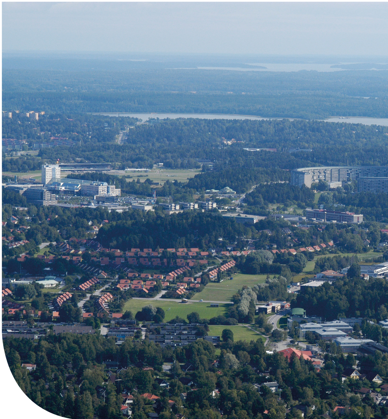
Flygbild över Täby, Täby Centrum och Grindtorp. Bilden togs från helikopter på väg till de arkeologiska undersökningarna i Karby och Sylta.