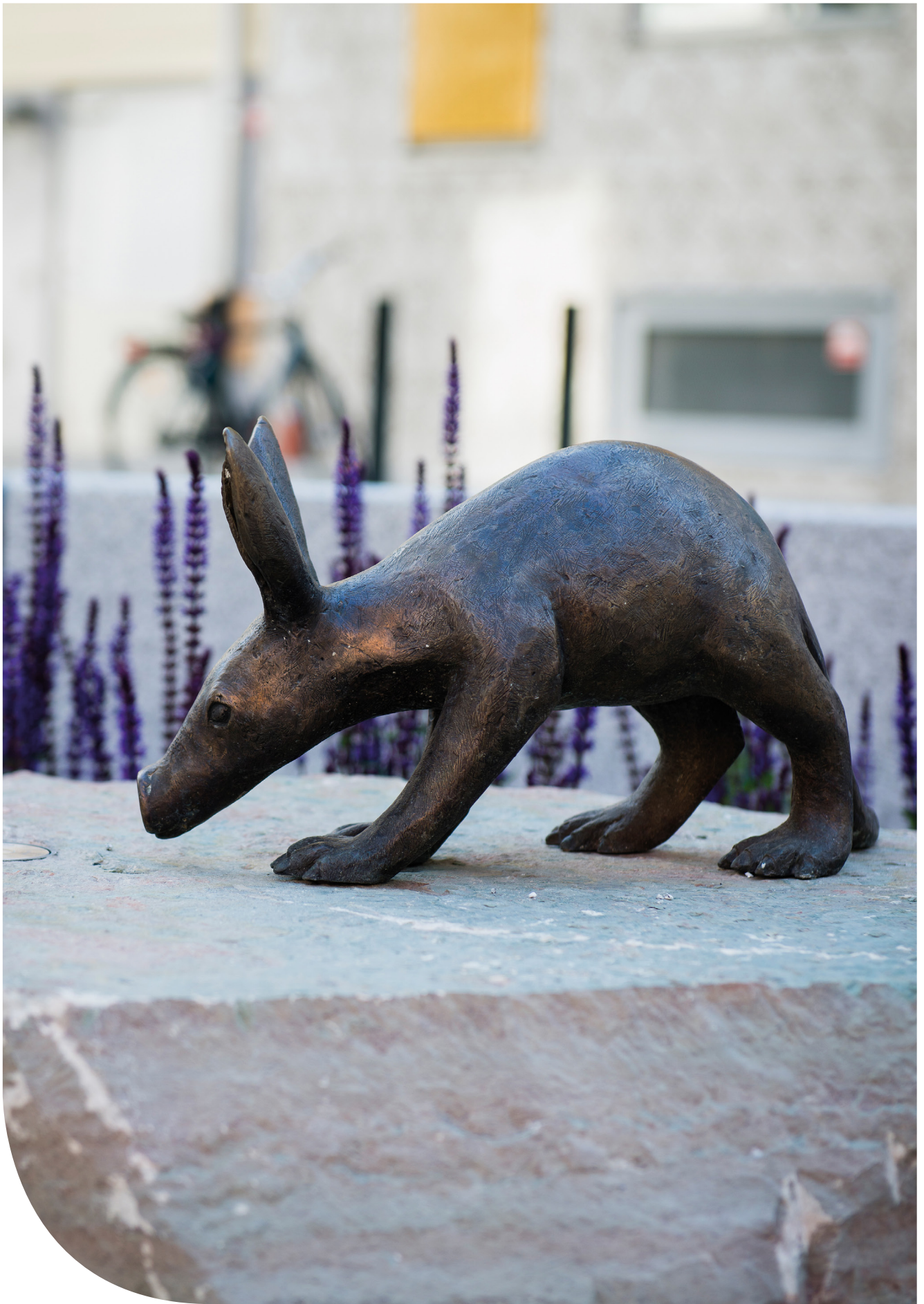
Djur i Vänortsparken. Jordsvin. © Eva Fornå/ Bildupphovsrätt i Sverige 2018. Foto: Eva Dalin