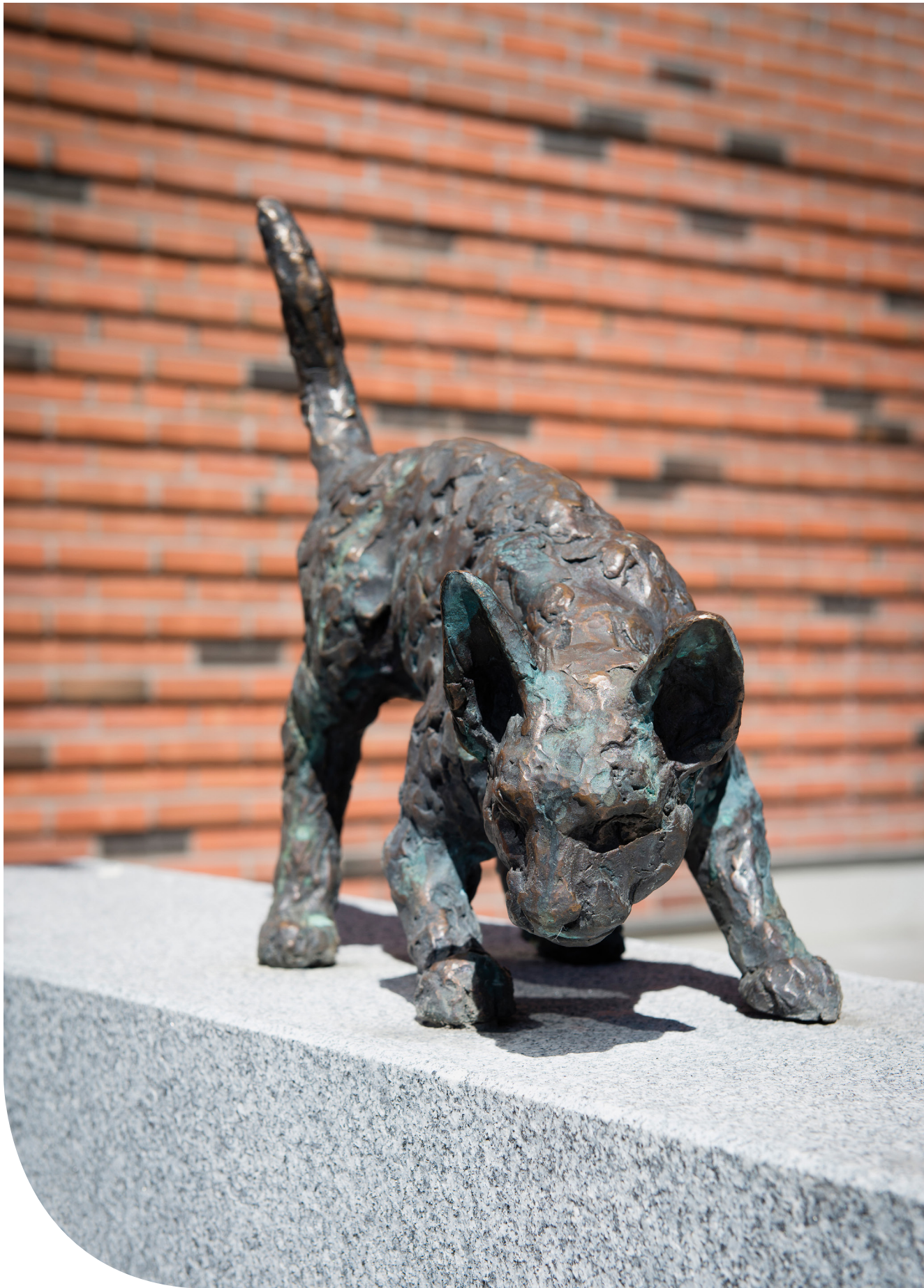
Katten Toulouse. © Hermine Keller/ Bildupphovsrätt i Sverige 2018.