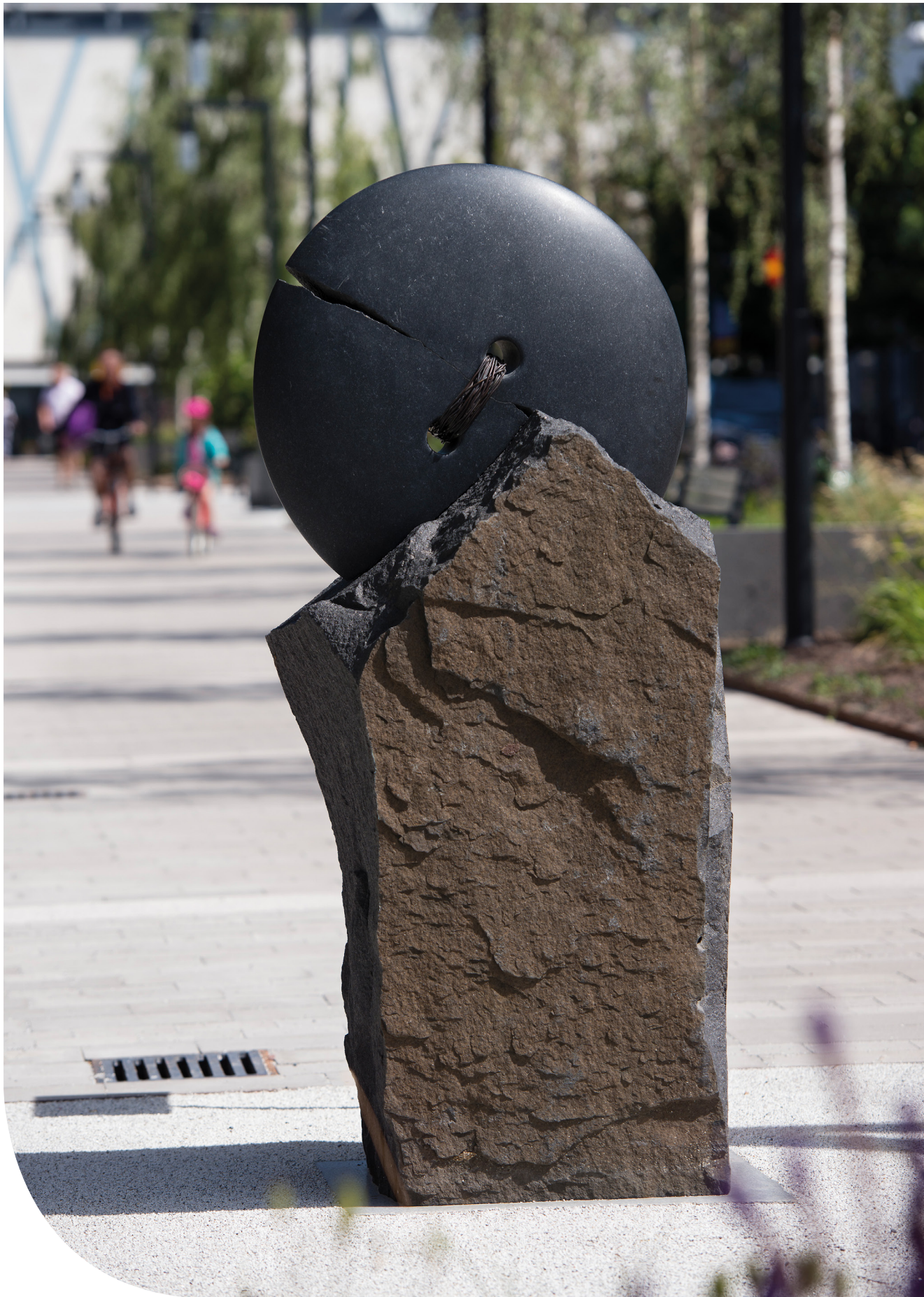
Svart knapp. © Hiroshi Koyama/Bildupphovsrätt i Sverige 2018. Foto: Eva Dalin