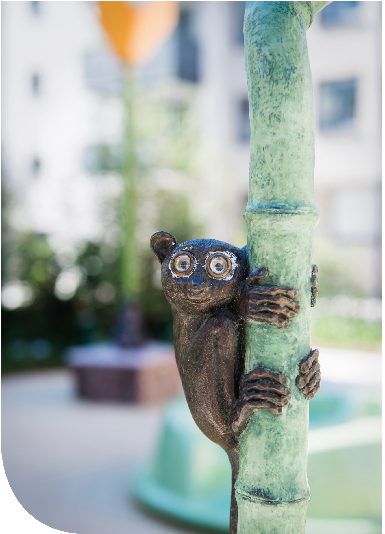
Djur i Vänortsparken. Spökdjur. © Eva Fornå/ Bildupphovsrätt i Sverige 2018. Foto: Eva Dalin