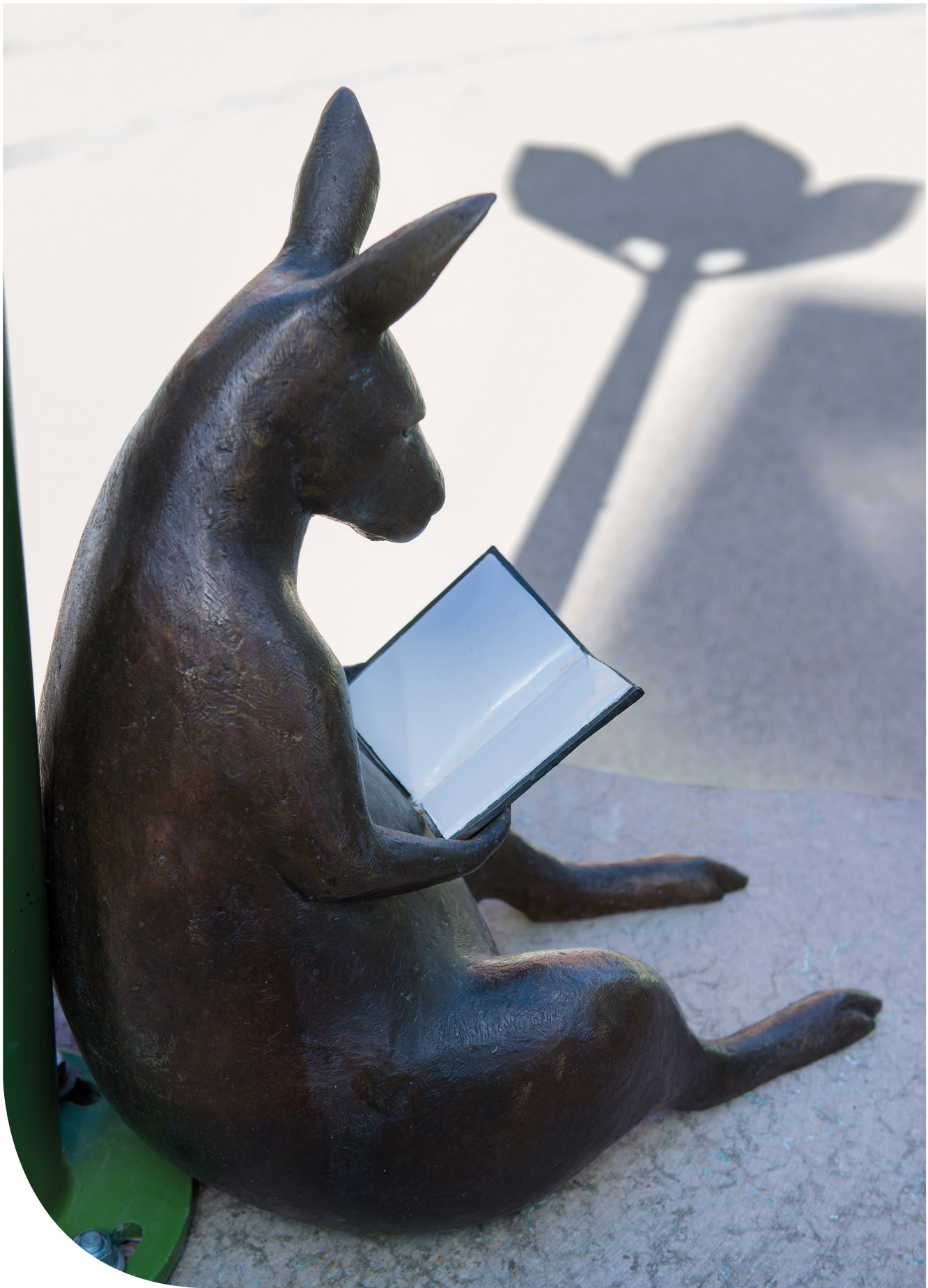
Djur i Vänortsparken. Wallabe. © Eva Fornå/ Bildupphovsrätt i Sverige 2018. Foto: Eva Dalin