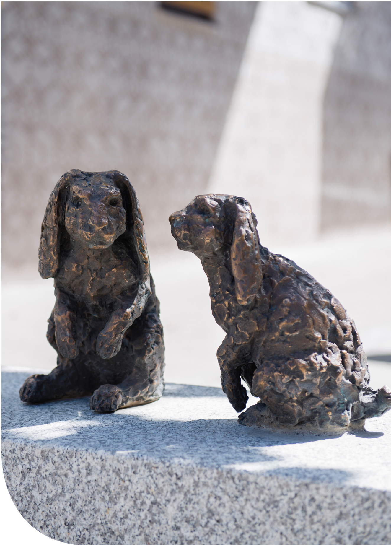
Kaninerna Kalle och Karin. © Hermine Keller/ Bildupphovsrätt i Sverige 2018.