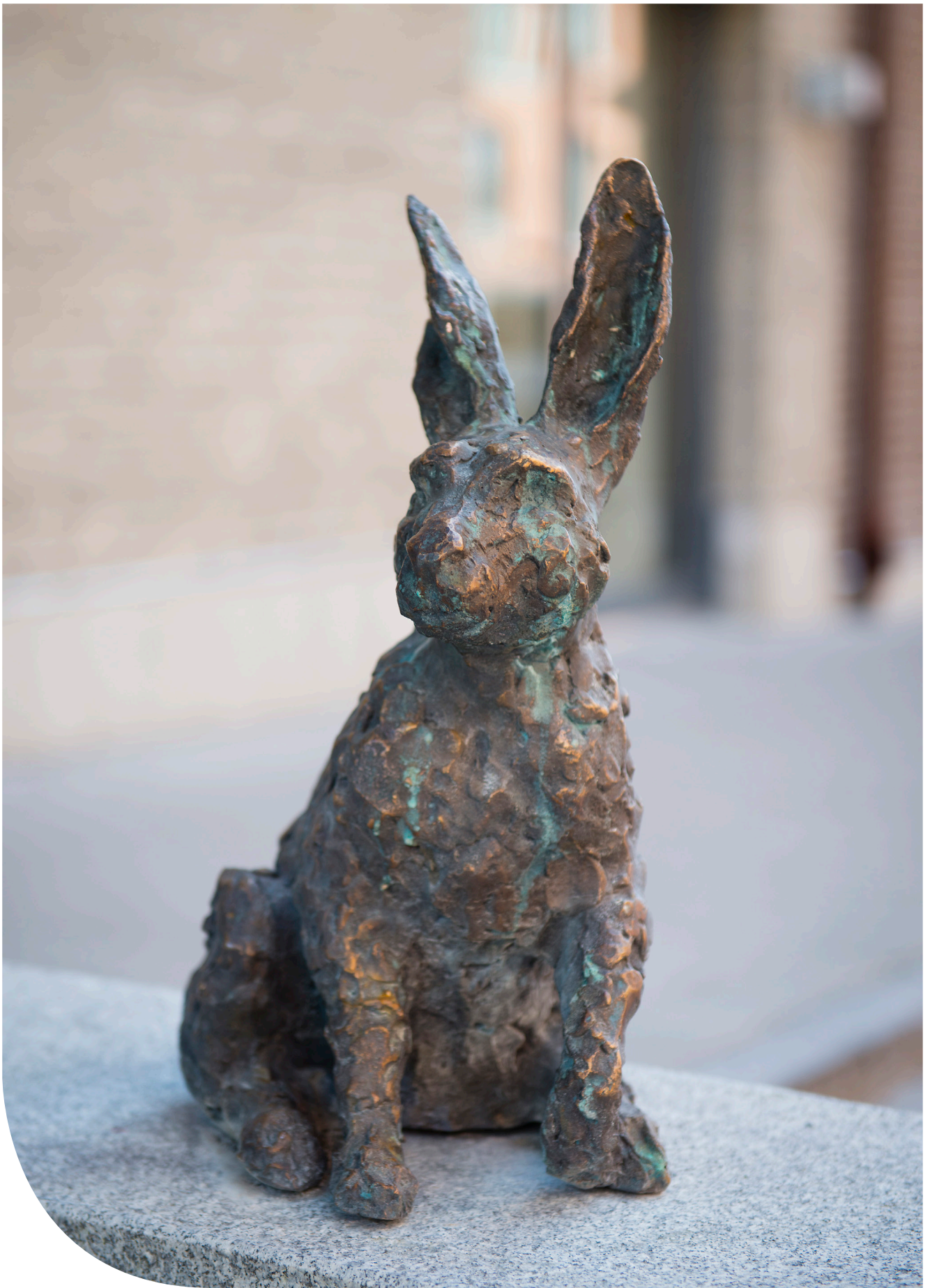
Haren Hassan. © Hermine Keller/ Bildupphovsrätt i Sverige 2018.