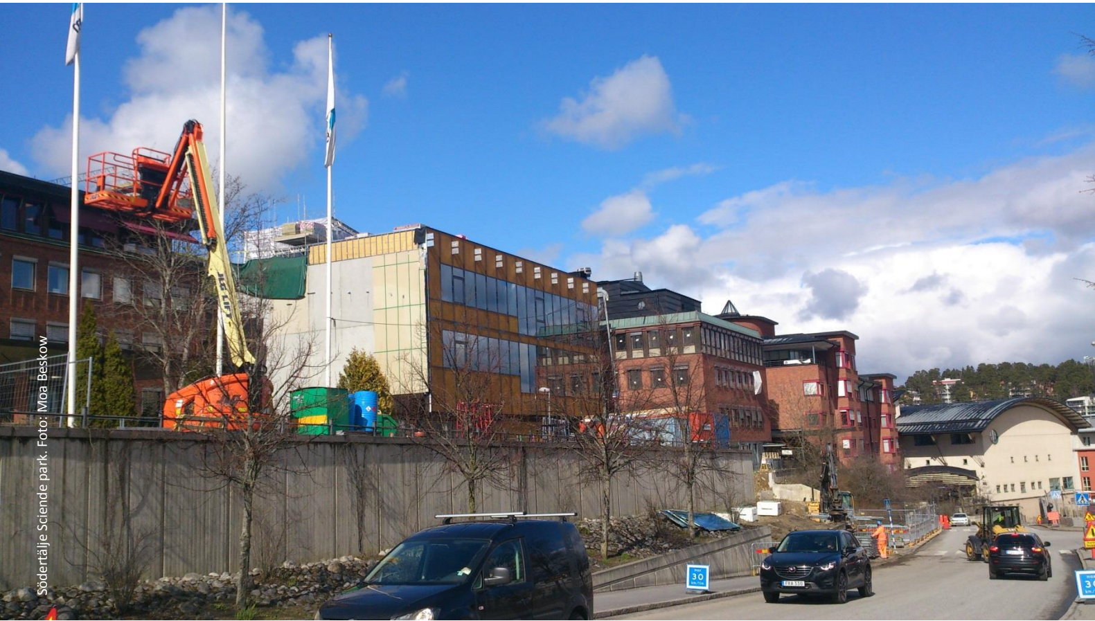
Södertälje Science park.